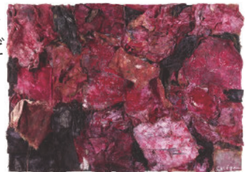
宮崎進《「ヒロシマ」LAND》2006 —特集1「大地」より

【会期】 5月19日(火)～6月21日(日) ※会期延長 【開館時間】 10:00-17:00 ※入場は16:30まで 【休館日】 月曜日 【観覧料】 一般300円、大学生200円、高校生・65歳以上150円 ※中学生以下無料