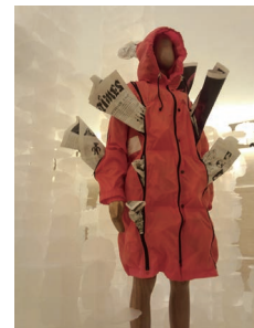
津村耕佑 《FINAL HOME(ファイナル・ホーム)》

1959年埼玉県生まれ。82年に第52回装苑賞を受賞し、翌年、三宅デザイン事務所に入社し三宅一生氏の下、クリエイションスタッフとしてパリコレや様々な展覧会に関わる。94年に都市型サバイバルウェアを考案、自らのブランド「FINAL HOME」を立ち上げる。同年に第12回毎日ファッション大賞新人賞を、2001年に織部賞を受賞。ファッションデザイナーとして活動すると同時に、国内外の多数の展覧会に参加し、時代・社会・都市を見つめる造形作家としても制作活動を続ける。