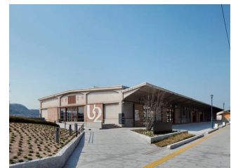
谷尻誠《ONOMICHI U2 part1》