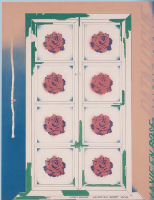
井田照一《LA VIE EN ROSE-FRESH WIND》1973 東広島市立美術館蔵