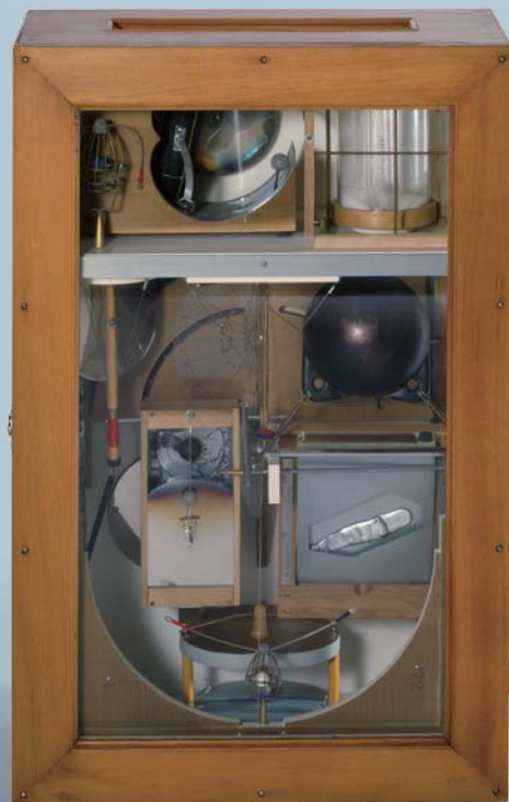
加納光於、大岡信《アララットの船あるいは空の蜜》1971-72 広島市現代美術館蔵