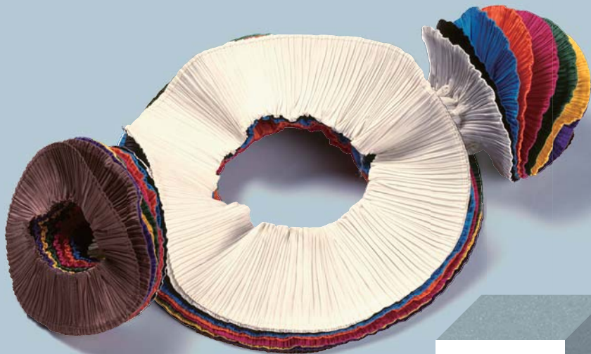
三宅一生 《フライング・ソーサー》 1993/1994 広島市現代美術館蔵