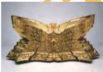
三輪龍氣生《続・串弥呼の書No.5》 1992(平成3)年 広島県立美術館蔵