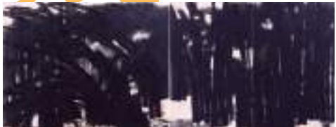
丸木位里《竹林》1964(昭和39)年 広島県立美術館蔵