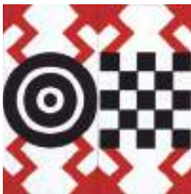
菅井汲《TAMBOUR(鼓手)》 1993(平成5)年 広島県立美術館蔵