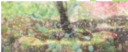
大岩オスカル《FLOWER GARDEN》2004(平成16)年 左右:広島市現代美術館蔵、中央:個人蔵(広島市現代美術館蔵寄託) © Oscar Oiwa