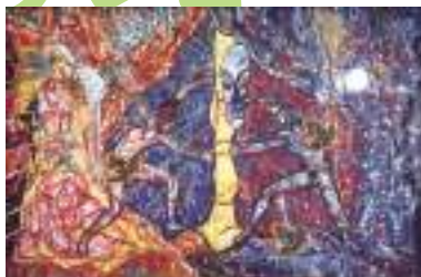
横尾忠則《天の岩戸》 1985(昭和60)年 広島市現代美術館蔵