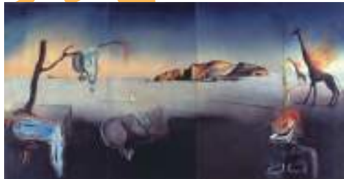
サルバドール・ダリ《ヴィーナスの夢》1939年 広島県立美術館蔵 © Salvador Dalí, Fundació Gala-Salvador Dalí, JASPAR Tokyo, 2022 G2913