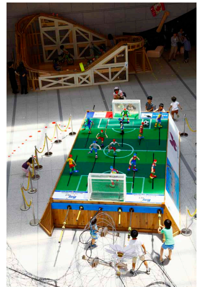
「こどものにわ」(東京都現代美術館 2010) KOSUGE 1-16 作品展示風景

絵描きのおじさんが小さい頃に遊んでいたような昔懐かしいおもちゃ、操り人形や板返しや赤ベコなど…。本展参加アーティスト・KOSUGE 1-16と一緒に、それらの仕組みを使って仕掛けを大きくさせたり、違うルールを作ったりと、「むかしあそび」を「いまのあそび」に変えて遊びます。