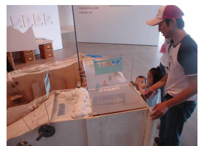
「青葉緑日2」(せんだいメディアテーク 2007) KOSUGE 1-16 作品展示風景

※友達同士なども1枚のはがきもしくはメールで一緒に申し込むことができます。 ※メールでのお申し込みについては、締切の翌日までに受付完了の返信メールをお送りします。届かない場合はご連絡ください。 ※締切後でも定員に満たない場合は参加を受け付けますので、当館ホームページで確認いただくか、電話でお問い合わせください。