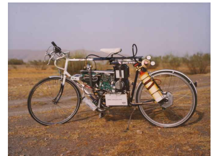
《タバベルナ砂漠走行》2004 Courtesy of the artist and the Modern Institute/ Toby Webster Ltd., Glasgow Photo: Simon Starling