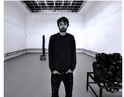
サイモン・スターリング（ポートレート）