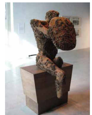
《蔓延作品（貝付きムーア）》 2007/08 Courtesy of the artist and Casey Kaplan, New York. Photo: Steve Payne

広島市現代美術館（学芸担当：神谷、齋藤 広報担当：後藤、鈴木） 〒732-0815 広島県広島市南区比治山公園 1-1 TEL/ 082-264-1121（掲載用）・082-264-1146（問い合わせ用・学芸直通） FAX/ 082-264-1198 E-MAIL/ hcmca@hcmca.cf.city.hiroshima.jp