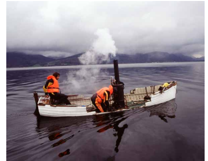
《オートザイロパイロサイクロボロス》2006

本展は、スターリングのリサーチを核に、現代において美術を通じ広島と世界を繋ぐ様々な関係性をひも解きます。