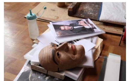
マスカレード 《仮面劇のためのプロジェクト(ヒロシマ)》2010より、 制作風景(参考写真)