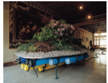
《雑草の島(プロトタイプ)》2003 Courtesy of the artist and The ModernInstitute/ Toby Webster Ltd., Glasgow Photo: Jeremy Hardman- Jones