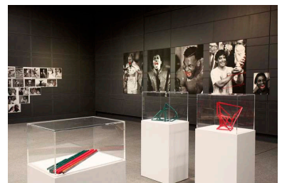
フィロズ・マハムド 《Rescued Stardom》2009