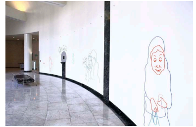
いしかわ かずはる 《"WE ALIVE"》2009