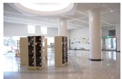
太湯雅晴 《LOCKER GALLERY at Hiroshima MOCA》2010