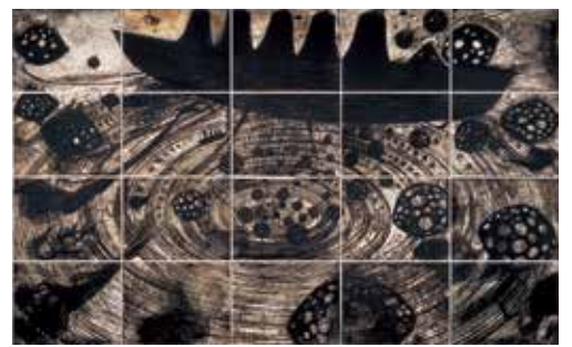
《Calder Hall Ship-ENOLA GAY》1994 西宮市大谷記念美術館蔵