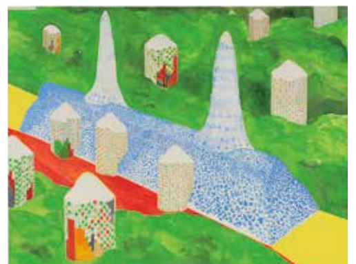
《方舟光の樹!》2012 作家蔵