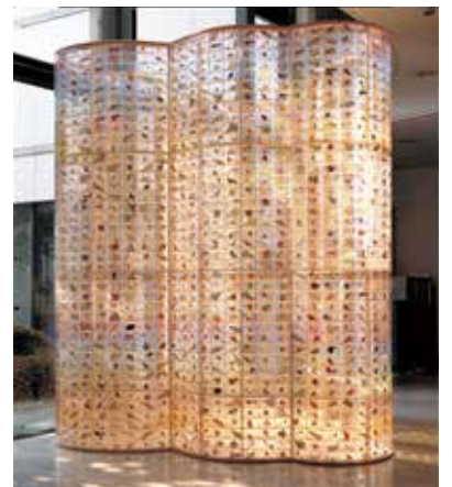
カセットプラント《光の樹/粒子と稜線》2005 作家蔵