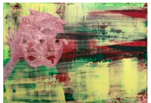
《共存する2つの顔、世界/のためのcore》2018 作家蔵