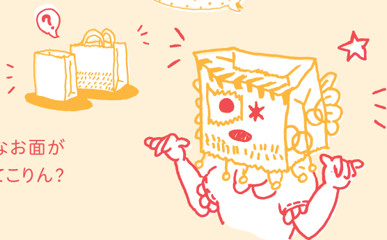
イラスト: 峰崎まや