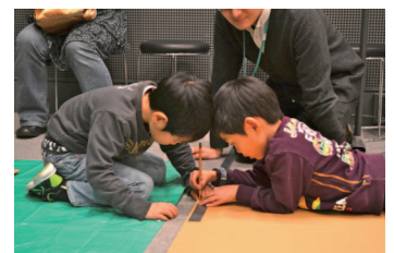
参考写真：上記5点すべて(過去のワークショップより)