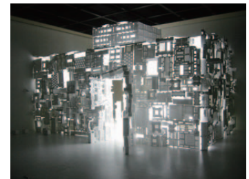
開発好明 《ホワイトハウス》2003 パルテノン多摩、東京