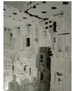
開発好明 《ホワイトハウス》内部