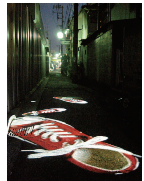
志村信裕 《赤い靴》2009年 (黄金町パザールでの展示)