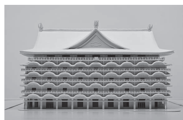
大阪新歌舞伎座（1958）模型 縮尺 1/200 制作・所蔵：京都工芸繊維大学木村・松隈研究室