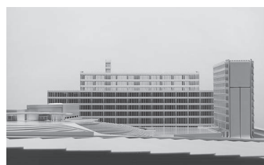
千代田生命本社ビル（現目黒区総合庁舎） （1966、2003改修）模型 縮尺 1/200 制作・所蔵：京都工芸繊維大学木村・松隈研究室