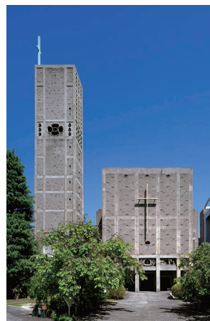
世界平和記念聖堂