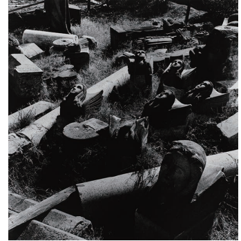
《爆風により崩壊した浦上天主堂の天使像 本尾町》1961年